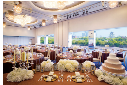
銀河 GINGA 3階(493㎡) 収容人数 240名