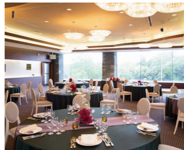
星華 SEIKA 2階(212㎡) 収容人数 80名