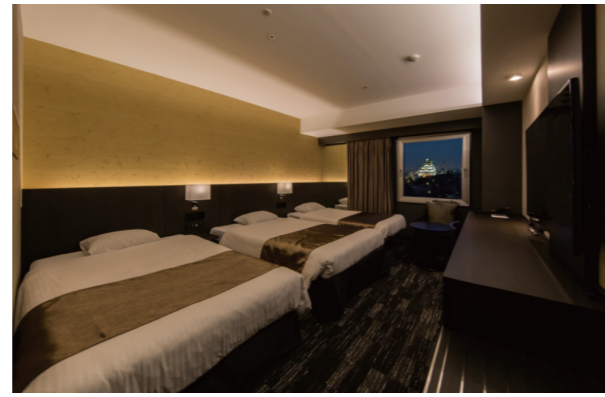
ツイン 25.6㎡ 写真はトリプル利用時のイメージです