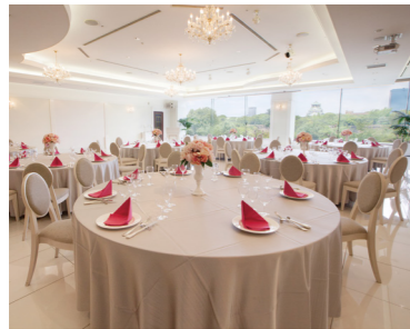
白鳥 HAKUCHO 2階(217㎡) 収容人数 80名

人数に合わせた会場を他にもご用意しております。大阪城が全会場からご覧いただけます。人数によってレストラン個室になる場合もございます。